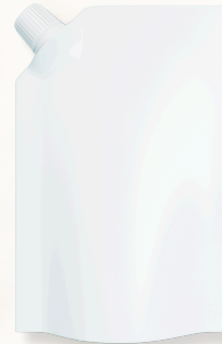
ブラウンピスタチオシロップ/パウチタイプ