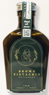
ブラウンピスタチオシロップ/瓶タイプ

家での贅沢なひとときや、ギフトとしても人気です。 六本木や目黒のマルシェでは連日完売し、多くのインバウンド観光客からも「日本でしか出会えない特別な味」として高評価を得ています。